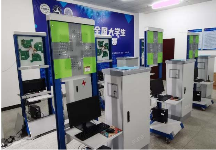
图3 交通信号控制仿真实验平台

(4) 交通系统仿真软件。本专业为满足专业课程仿真实验教学需求，购置了包括 Vissim、Synchro、mapinfo、城市道路流量调查等各类仿真与应用软件近十套，可以模拟高速公路、城市道路、道路标志线、路灯、交通信号灯等交通设施，实现单点交通信号配时、区域交通配时、实时信号交互、数据管理、交通数据采集与分析、方案评价等功能。学生可根据自身兴趣利用这些软件开展各类模型创新和仿真系统应用实践活动，提升学生对专业理解能力、锻炼学生动手实践能力。