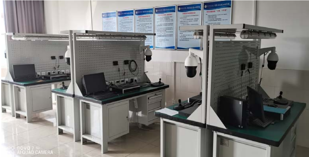
图 2 视频图像检测与应用实验台

(3) 交通信号控制仿真实验平台。本平台采用工程化设计，实验内容与工程实践紧密结合，学生可以在教师的指导下，了解交通信号机交通数据采集的工作原理和输出形式，了解交通信号机的硬件结构和工作流程，通过操作实践，真正掌握交通检测信号接入、信号机与灯组的连接、信号控制相位设计、各种信号控制方案设计、信号配时方案输入信号控制机运行、信号控制效果评价、信号机运行故障排除等技术，能够强烈提升学生对于信号控制相关理论与方法的感性认识 and 实际动手能力。