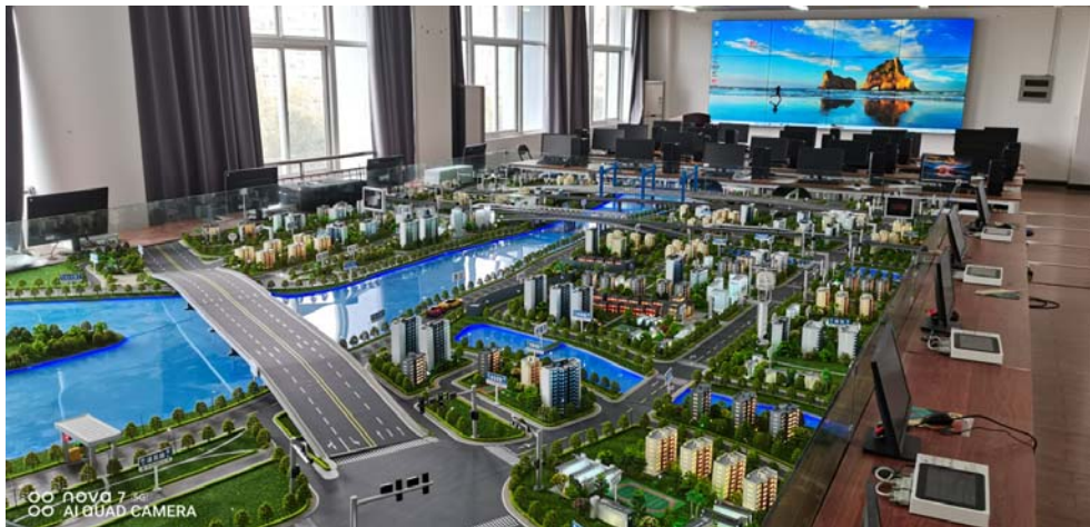
图 1 智能交通仿真集成实验平台

路、交叉口、公交站、停车场和道路标志标线等交通基础，安装路灯、交通信号灯、车辆检测传感器、摄像头、道闸和信息发布板等交通前端模拟设备，并应用循迹行驶或模拟驾驶系统车辆组成完备的模拟交通环境，为交通工程实验提供基础平台。